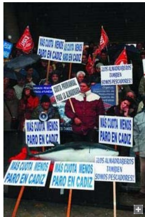
Protesta de los almadraberos en Madrid ante la sede del Ministerio.

Casi sin bajarse de los cinco autobuses fletados para la ocasión, los manifestantes gaditanos