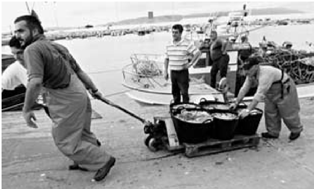
Los barcos que pescan pulpo no podrán repartir sus capturas de forma semanal este invierno | CAPOTILLO

Así, pese a aumentar el techo de capturas en invierno, se