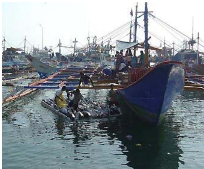
Más de 2.000 pescadores de atún serán afectados por las vedas aplicadas en aguas del Pacífico.