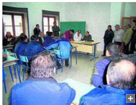
Los pescadores de Tarifa, durante la reunión celebrada ayer en la cofradía local.

Los marineros exigen que la parada biológica sea subvencionada como en años anteriores -el pasado año se subvencionó de manera extraordinaria a través de la Junta de Andalucía y no con fondos comunitarios- o en su defecto no acogerse a lo estipulado en la Orden ARM/3536/2009 de 23 de diciembre por la que se define el nuevo Plan de Pesca del Voraz en el Estrecho y que tiene como principales novedades su vigor bianual además de definir sin ambigüedades posibles el tamaño de los anzuelos empleados en las capturas, estableciéndose para los mismos un largo