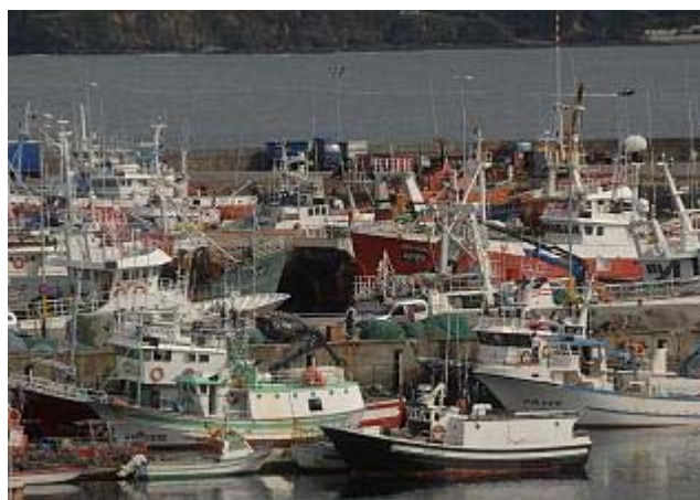
Flota amarrada en el muelle de Oza.

problemas con la aplicación informática que se utiliza para la transmisión de los datos o con las claves de acceso al sistema, que debe proporcionarles la Secretaría General del Mar.