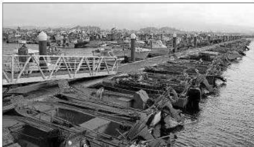
Agentes de la policía local en las instalaciones de Tragove.

Pero también se ha denunciado la falta de otro tipo de objetos más específicos, como pueden