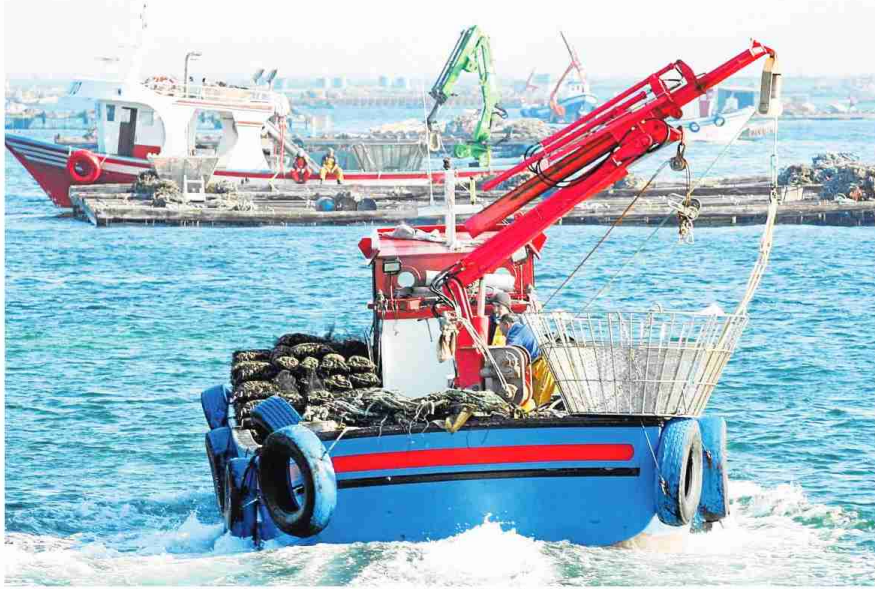
El sector pesquero y bateiro alerta de los perjuicios de la aplicación del nuevo sistema.

Este cambio no dejó de generar una gran satisfacción entre los productores franceses durante estos primeros días del año. Así, y según se recoge en los medios galos, Goulven Brest, presidente del