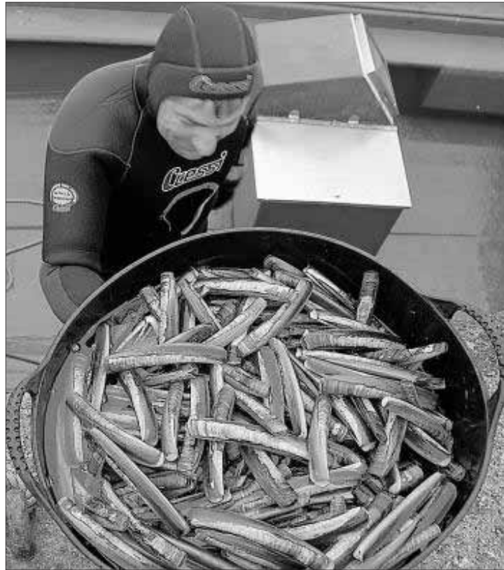
Buzos de A Illa durante una descarga de navaja.